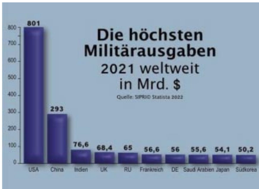
Abb. 1 Rüstungsausgaben 2021 (Daten von SIPRI)

Armeen nichts mehr taugen und entschieden überstürzt wieder aufzurüsten. Zum Vergleich: Im Jahr 2022 betragen die Rüstungsausgaben der Schweiz 5.2 Mia. Franken.