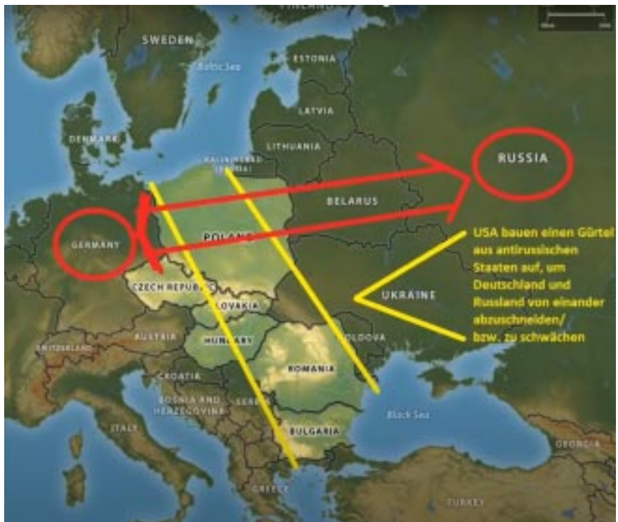
Abb.2 Der Riegel zwischen Deutschland und Russland sei für die USA extrem wichtig, schreibt George Friedman [8] (Ein Deutsch-Russisches Bündnis muss nach der US-Denkfabrik STRATFOR unbedingt vermieden werden)

Konkret dazu äusserte sich George Friedman in seinem Vortrag [8] vor dem Thinktank Atlantic Council 2015, den er ursprünglich gegründet hatte. Darin erklärt er, dass die USA selber zu wenige Soldaten haben, um die Welt zu beherrschen. Daher müssten sie stets versuchen ihre Gegner gegeneinander aufzuhetzen, damit diese sich selber gegenseitig bekämpfen – so wie das z.B. die Engländer früher in Indien getan hätten. Oder auch wie die USA den Krieg zwischen dem Irak und Iran durch Waffenlieferungen an beide Seiten förderten. Die USA sollten die Länder destabilisieren und nur ganz gezielt intervenieren. Deshalb rüsteten die USA die „Frontstaaten“ zu Russland auf. Das erfolge nicht über die NATO, sondern verdeckt indirekt. Denn über die NATO wäre die Zustimmung aller Beteiligten notwendig gewesen [18].