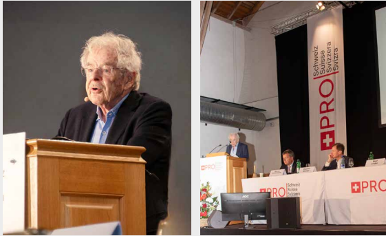
Vortrag an der Mitgliederversammlung «Pro Schweiz» vom 18. April 2026 in Bern